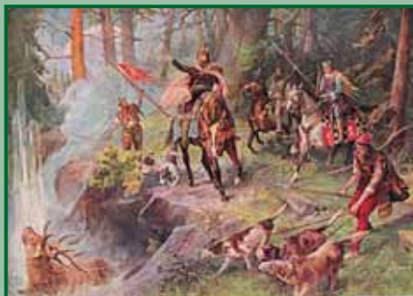
Založení města Karlem IV.