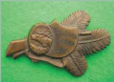
Střelecké závody ČMS Karlovy Vary 1957