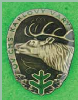
OV ČMS Karlovy Vary