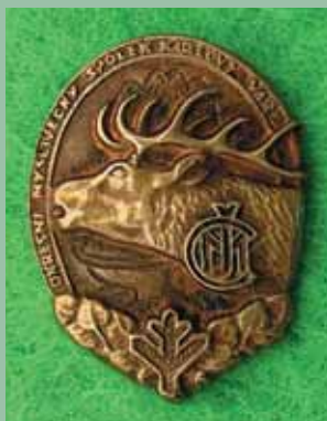
Okresní myslivecký spolek Karlovy Vary - klopový