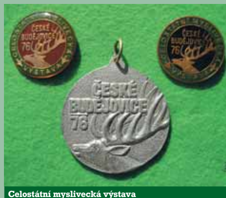
Celostátní myslivecká výstava