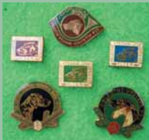
Oblastní výstava loveckých psů