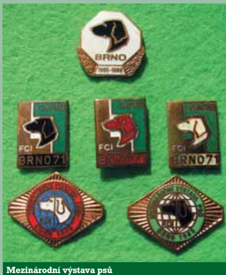
Mezinárodní výstava psů

Myslivecké výstavy patří mezi atraktivní a populární společenské události. Mají bohatou minulost i současnost. Oslovují laickou i odbornou veřejnost. Slouží jak k ukázce výsledků chovatelské práce a k bilancování, tak i k hodnocení předložených trofejí. Zároveň jsou významné z hlediska setkání myslivců, lesníků, vědeckých pracovníků i přátel myslivosti.