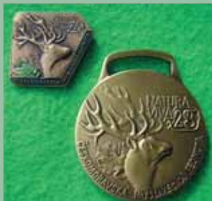
Natura Viva 2005