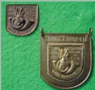
Soutěž trofejí 1936